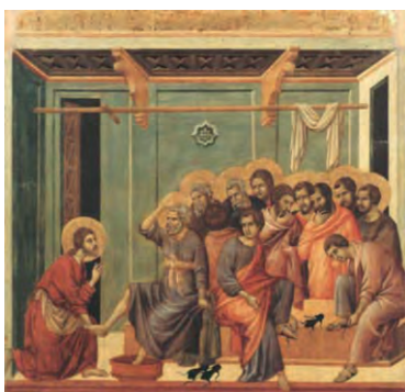
Ντούτσιο ντι Μπουονινσένια, Ο νιπτήρας.