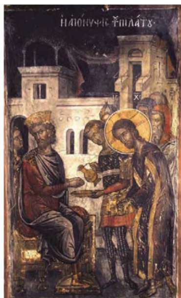
Η απόνοιψις του Πιλάτου. Θεοφάνης ο Κρησ,