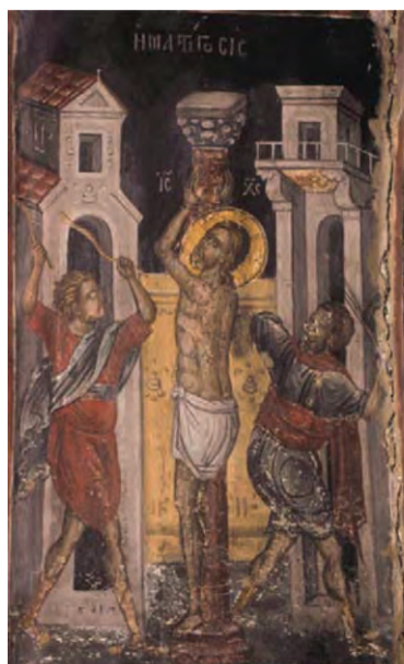
Η μαστίγωσις. Μονή Αγ. Νικολάου-Μετέωρα.

Είναι σημαντικό, παρατηρώντας τις παρακάτω εικόνες στις οποίες ο Χριστός απεικονίζεται μπροστά στην εξουσία, να σχολιάσουμε το θέμα: «Η εξουσία ως διακονία».