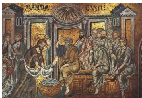
Ιερά Μονή Αγίου Νικολάου, Ιερός Νιπτήρας, ψηφιδωτό, Καθεδρικός Monreale, Ιταλία.