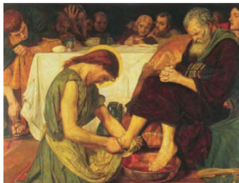
Ford Madox Brown, Ο Χριστός πλένει τα πόδια του Πέτρου, 1851-1856. Πινακοθήκη Tate Britain. Λονδίνο.